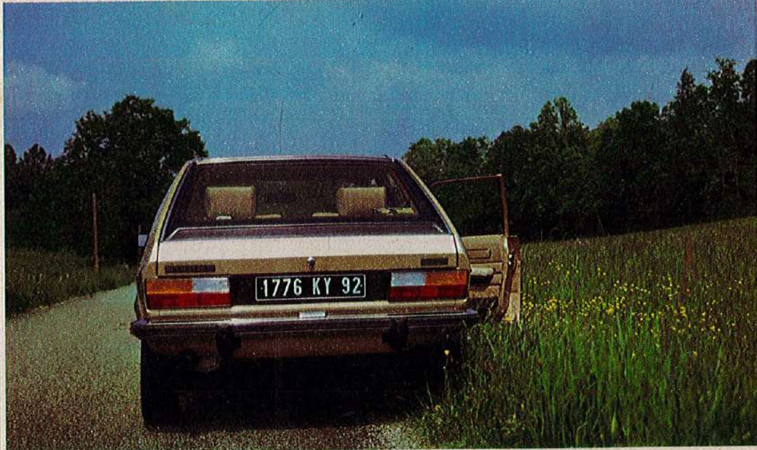
Le coût d'utilisation d'une telle berline conduira certains de nos lecteurs à « descendre » dans la gamme du constructeur.

« Qualités routières inexploitées du fait de l'équipement pneumatique et de la souplesse de la suspension arrière » (M. Klefer).