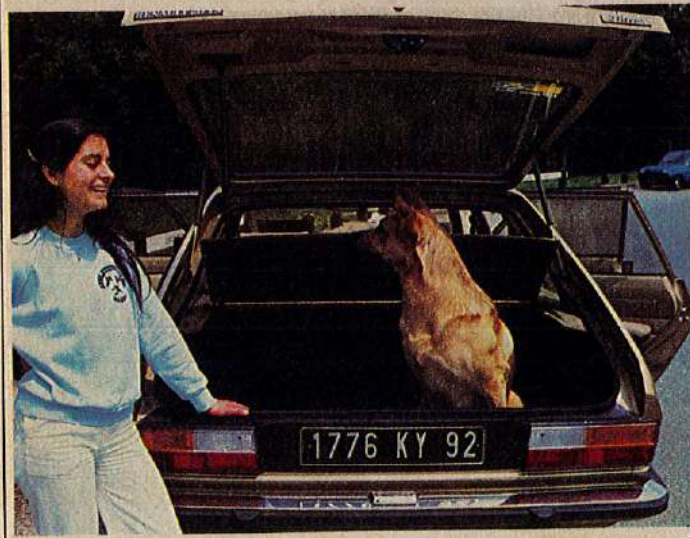
« Bonne et belle routière », la R20 TS est aussi appréciée pour son espace habitable et le volume important de son coffre.

Quelques nuances méritent tout de même d'être citées : « La R 20 n'aime pas être bousculée dans les virages » (M. Antier), ou bien encore « elle n'aime pas les coups de frein brusques ». Les remarques de MM. Delabie et Kiefer suggèrent le remède : « La tenue de route serait meilleure avec les pneus TRX de la R. 20 TX »... « Elle serait irréprochable si l'équipement pneumatique était à la hauteur ». La Renault 20 étant une berline à vocation familiale, il est naturel d'assurer un confort de suspension honorable, mieux accordé à une conduite coulée qu'à un pilotage de rallye. Il n'est donc pas étonnant que la caisse se montre parfois réticente à obéir aux coups de volant un peu vifs ou ait tendance « à piquer du nez dès qu'on pile », comme nous le dit M. Echène. De