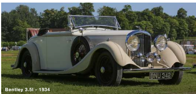
Bentley 3.5l - 1934

D eux ans après avoir fêté son centième anniversaire, Bentley prendra ses quartiers à Époqu'Auto pour une retrospective majeure. Après Maserati en 2019, c'est la marque anglaise née au nord de Londres qui occupera le plateau prestige du salon. Sur environ 500 m 2 de surface d'exposition, le Club des 3A s'est appliqué à réunir une