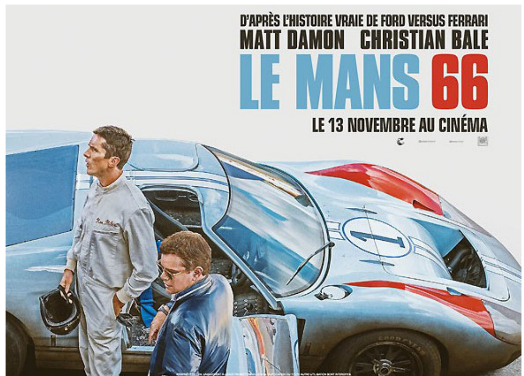
Affiche du film Le Mans 66

Cette voiture mythique est l'héroïne du film Le Mans 66 de James Mangold sorti en novembre 2019, interprété par Christian Bale et Matt Damon. Il relate la rivalité entre les deux constructeurs, qui connut son apogée aux 24 Heures du Mans en 1966.