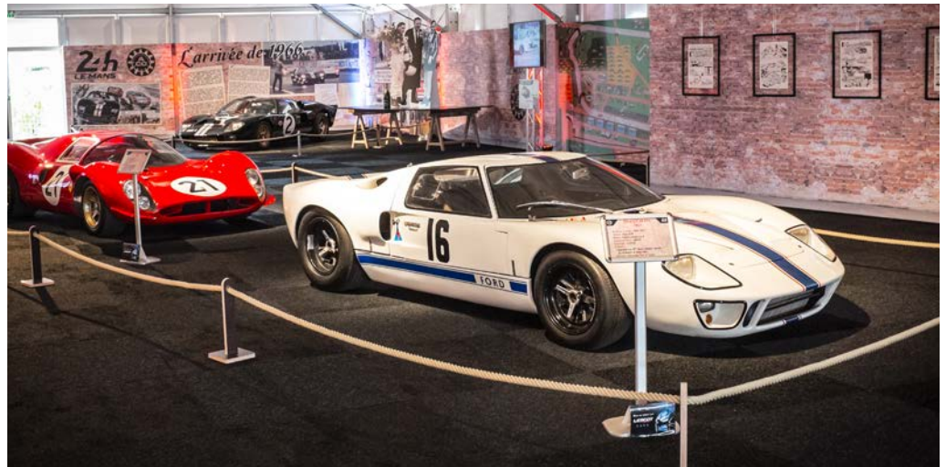
La Ford GT 40 exposée au Musée des 24 Heures du Mans

Les GT 40 sont conçues sans aucune protection contre la corrosion. Les tôles d'acier utilisées sont laissées brutes, et leur assemblage génère de nombreux corps creux, totalement inaccessibles une fois le châssis terminé. Avec les années, l'humidité s'infiltré dans tous ces corps creux et dans les interstices entre les tôles. Une grande partie de la corrosion qui en résulte se situe au niveau des planchers et des bas de caisse. Ainsi, pratiquement toutes les GT 40 doivent faire l'objet d'une restauration de la monocoque, avec au minimum le remplacement des planchers.